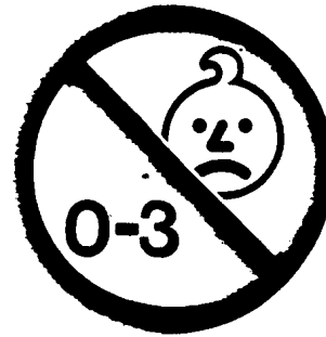
Fig. 1 - Simbolo di avvertimento sull'età

la gamma di età per la quale il giocattolo non è idoneo, deve essere espressa in anni, cioè 0-3.