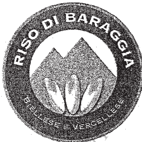
Immagine del logo