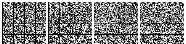
Tabella 2 Codifica numerica di aggiornamento dell'allegato